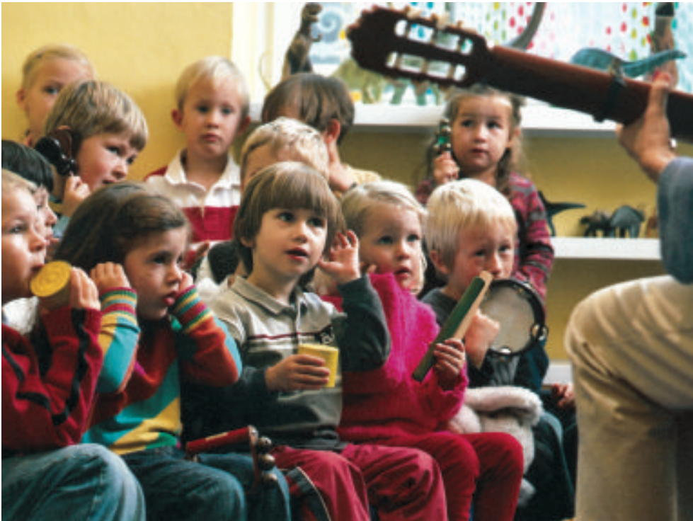
Musik weckt Aufmerksamkeit und Konzentration