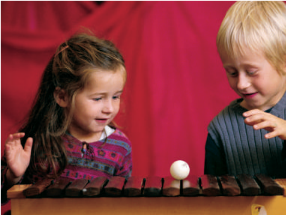
Ping-pong-Klänge auf dem Xylophon: ein Zusammenspiel von Auge, Ohr und Hand

keit zur Konzentration. Im musikalischen Miteinander entdecken sie die eigene Kreativität und gleichzeitig die Beziehung mit anderen. Hier können Kinder durch Erfahrung lernen.